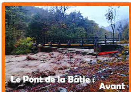
Le Pont de la Bâtie : Avant