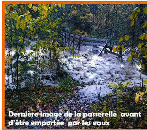
Dernière image de la passerelle avant d'être emportée par les eaux