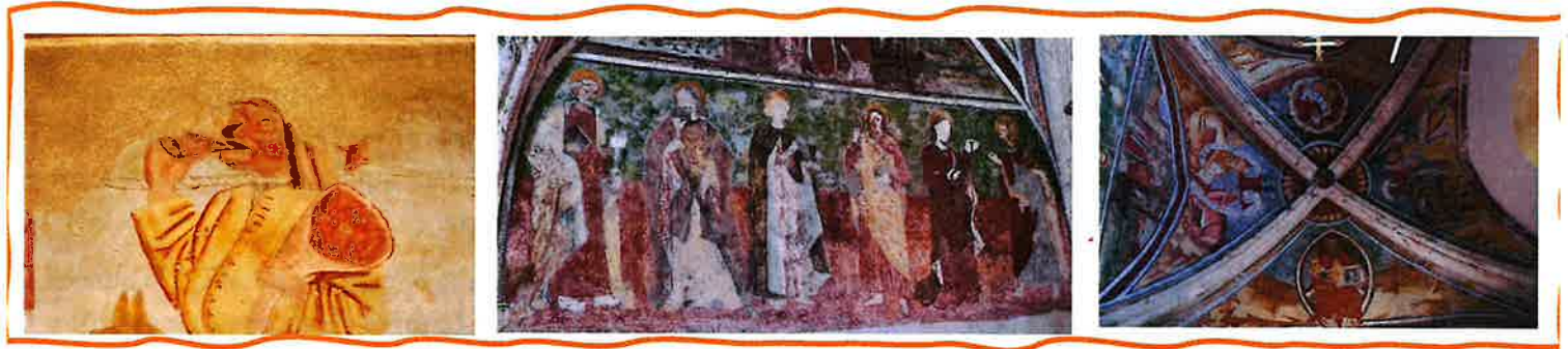
Alain Chaptal et Luc Maestragi Photos LM (Co-auteurs de la brochure sur la chapelle Saint-Vincent de Puy-Saint-Vincent)

Insistant sur la pénitence et exaltant le rôle de la Vierge, le riche programme iconographique de l'église des Vigneaux répond ainsi à un double objectif : conforter les fidèles dans leur foi mais aussi convaincre les Vaudois qui contestaient le rôle privilégié d'intercesseur de celle-ci. Un message clair pour mieux convaincre, et que l'on retrouve aussi, sous des formes différentes, à Puy-Saint-Vincent et à Vallouise.